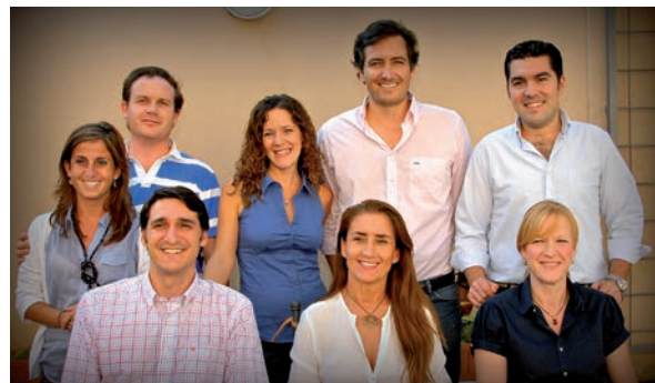
Miembros del Comité organizador del Congreso SECIB Cádiz 2012

El Congreso Secib Cádiz 2012 será un punto de encuentro de referencia para los profesionales de la Odontología. ! Os esperamos en Cádiz!