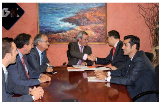
Miembros de la SECIB y de UBK asistentes a la firma del convenio